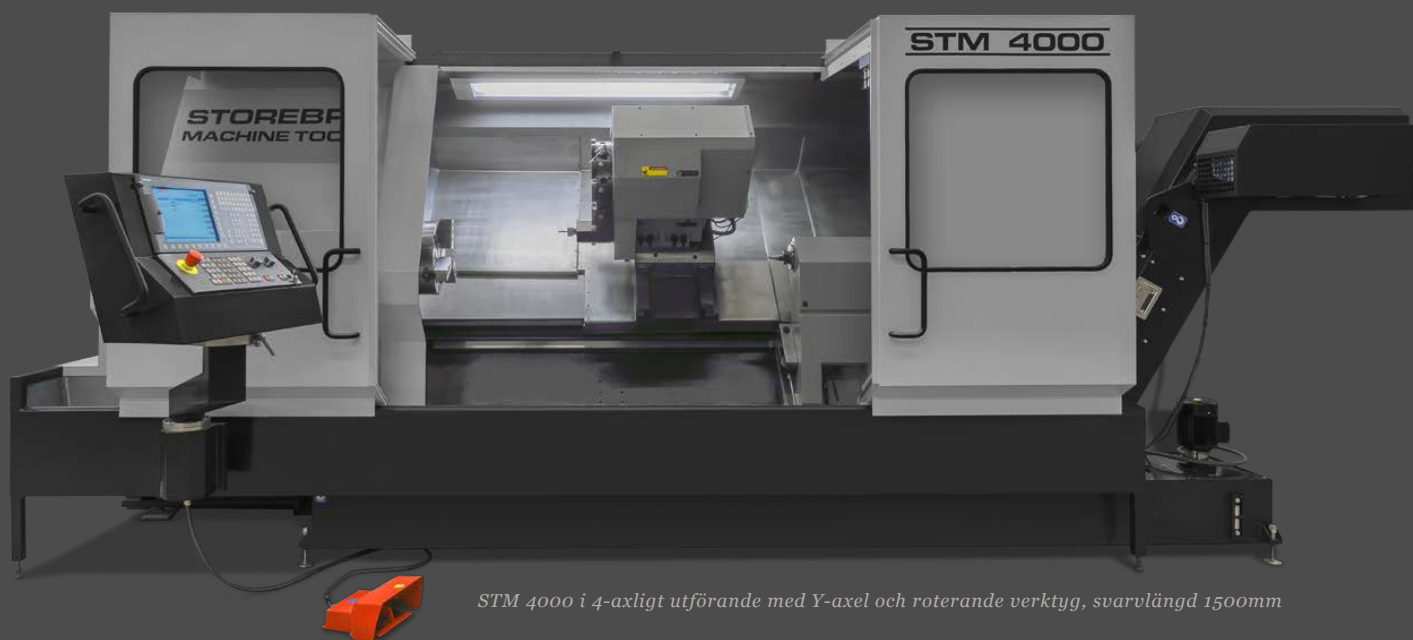
STM 4000 i 4-axligt utförande med Y-axel och roterande verktyg, svarvlängd 1500mm

Automatiska dörrar Styrd pinoldocka Detaljhämtare Y-axel