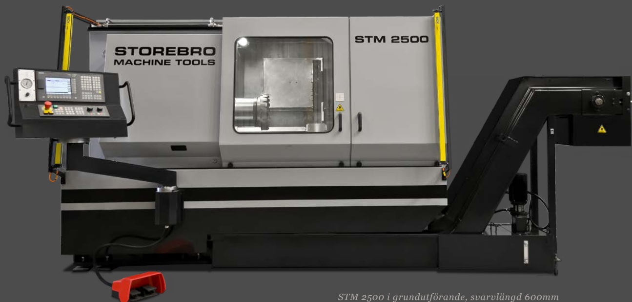
STM 2500 i grundutförande, svarvlängd 600mm

Våra CNC-Svarvar och Långhålsbormaskiner är konstruerade och utvecklade för att uppnå högt ställda krav från svensk industri gällande effektivitet, hög precision och stabilitet. Alla maskiner utformas och levereras anpassade för dina specifika krav för att optimera Er produktion.